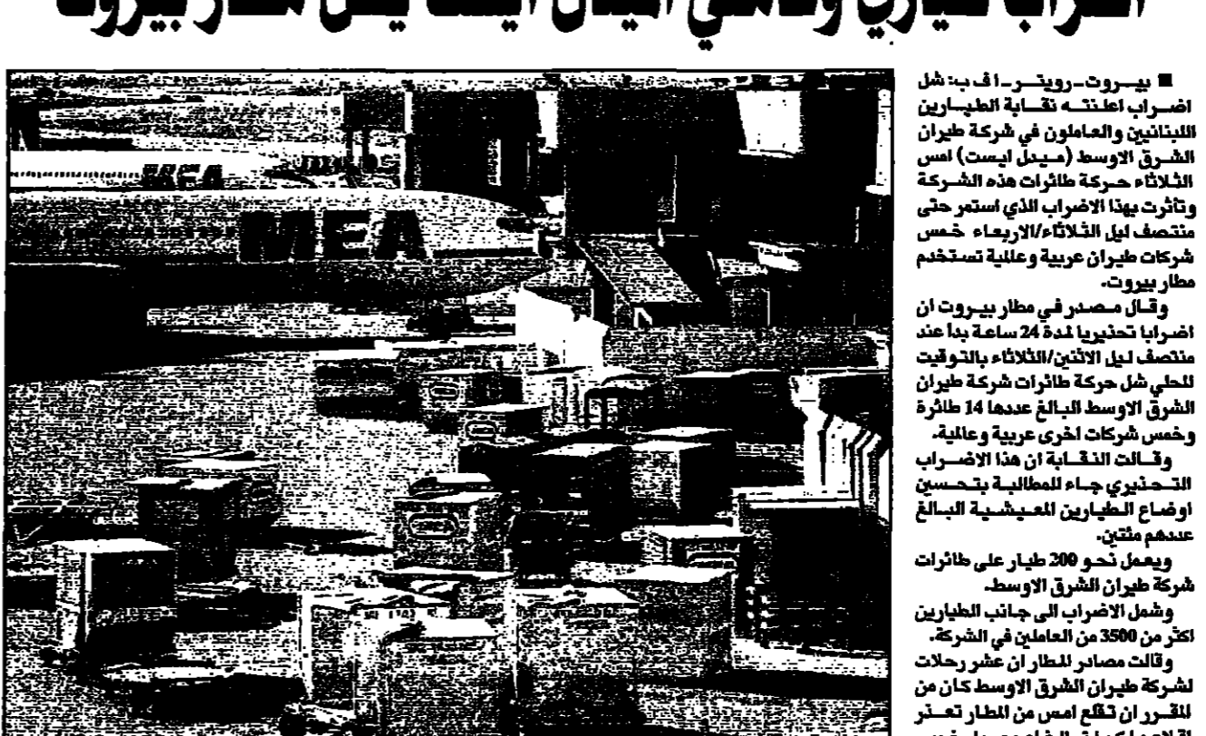
جانب من مطار بيروت حيث توقف العمل فيه تماماً أمس

بيروت-رويترز: فاضت اصراب الطيارين والعمالون في شركة طيران الشرق الاوسط (ميديل ايست) امس الثلاثاء حركة طائرات هذه الشركة وتأثرت بهذا الاضراب الذي استمر حتى منتصف ليل الثلاثاء 24 اياره.